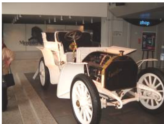
Muzej Mercedes – prvo vozilo z imenom Mercedes

Po tem ogledu je pot ekskurzije vodila v Untertürkheim pri Stuttgartu, kjer stoji Mercedesov muzej. Tu so kronološko prikazana praktično vsa Mercedesova oziroma Benzova vozila, ki so v zgodovini tega avtomobilskega giganta predstavljala svojevrstne mejnike. Tako je bilo moč videti prvo vozilo na motorni pogon, prvi avtomobil, na koncu spiralne vzpenjajoče poti pa je bil zelo opazen tudi priljubljeni dirkalnik Formule 1 McLaren – Mercedes.