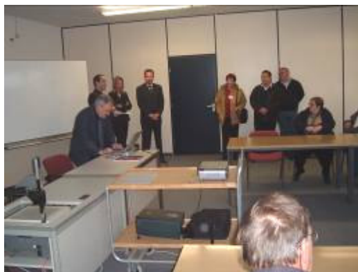
S predavitve podjetja HERION

Po tem ogledu je pot ekskurzije vodila v Untertürkheim pri Stuttgartu, kjer stoji Mercedesov muzej. Tu so kronološko prikazana praktično vsa Mercedesova oziroma Benzova vozila, ki so v zgodovini tega avtomobilskega giganta predstavljala svojevrstne mejnike. Tako je bilo moč videti prvo vozilo na motorni pogon, prvi avtomobil, na koncu spiralne vzpenjajoče poti pa je bil zelo opazen tudi priljubljeni dirkalnik Formule 1 McLaren – Mercedes.