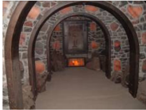
..... in utrinek iz rudnika

Tridnevni urnik je bil tudi tokrat torej povsem zapolnjen, pa vendar je po vsej verjetnosti upravičil pričakovanja udeležencev. Merilo oziroma dokazilo za tovrstno navdušenje bo zagotovo tudi njihova prijava v letu 2006, v katerem namerava DSIT Novo mesto nadaljevati s to predvsem strokovno koristno, pa tudi sicer prijetno dejavnostjo.