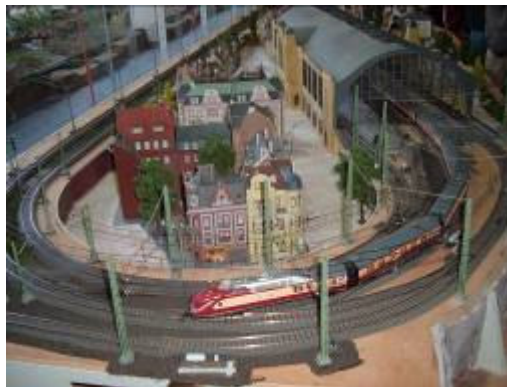
Utrinek iz železniškega muzeja v MÄRKLIN-u

Še isti dan je bila ekskurzija popestrjena s sicer nenačrtovanim kratkim ogledom železniškega muzeja v Märklinu, ki se nahaja v neposredni bližini lokacije prvoogledanega podjetja. Šlo pa je praktično le za ogled nekaj maket železniških kompozicij in demonstracij tovrstnih prometnih ureditev.