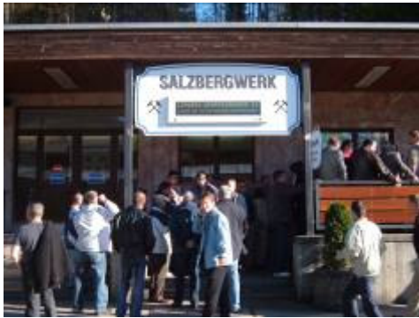
Pred rudnikom soli v Berchtesgadnu....

Na sami meji med Nemčiji in Avstrijo, natančneje v znanem letoviškem mestecu Berchtesgaden, pa je bil kot presenečenje udeležencem ekskurzije omogočen še ogled rudnika soli («Salzbergwerk«).